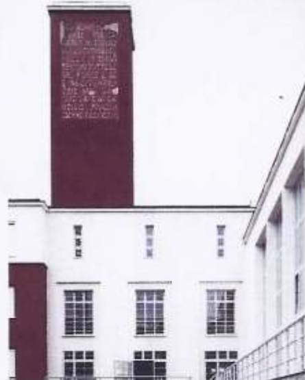
Tornet är ett ständigt återkommande fascistisk stadsbyggnadselement. I Forlì hackades den fascistiska ednen på tornet bort efter kriget. Nu när byggnaden är renoverad kan texten utläsas som en påminnelse om det förflutna.