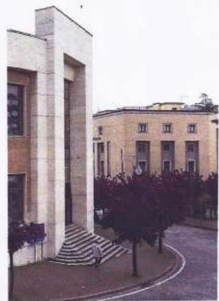
Casa del Fascio står tyst och öde vid Predappio stora torg.

”De bästa arkitekterna vi har haft var verksamma under den perioden. Men vi måste också diskutera politiken bakom byggnaderna.”