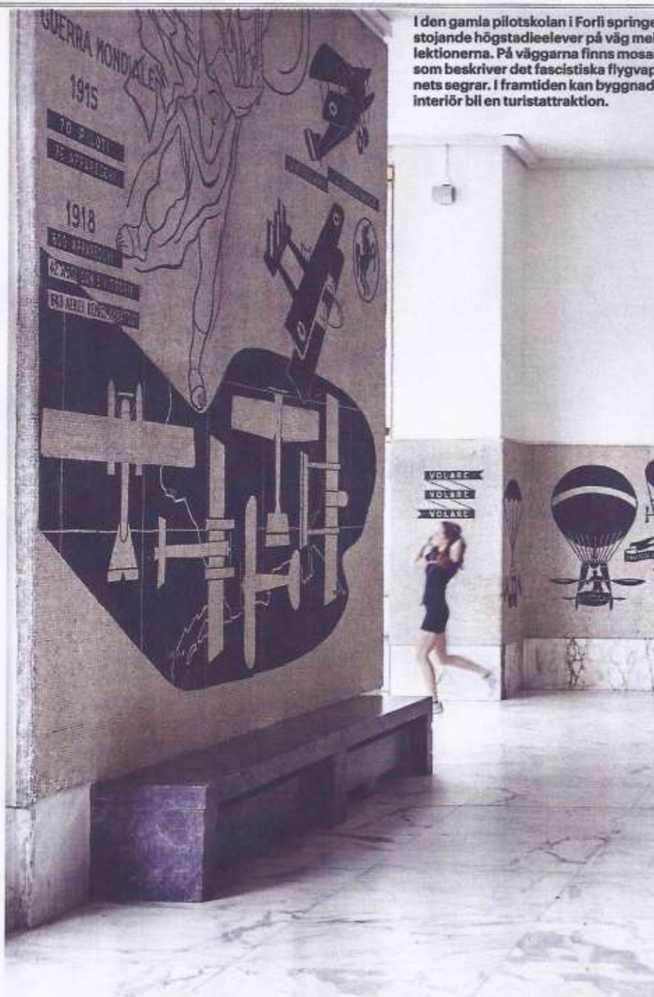
I den gamla pilotskolan i Forlì springe stojande högstadieselever på väg mellan lektionerna. På väggarna finns mosaik som beskriver det fascistiska flygvapnets segrar. I framtiden kan byggnadens interiör bli en turistattraktion.

Sällskapet åker vidare mot kyrkogården i stadens södra utkant. Nere i kryptan är det fullt med folk. Det är familjer med små barn, äldre par och unga män som långsamt och respektfullt stannar till framför Benito Mussolinis grav, ber en bön eller gör korstecknet. Flera